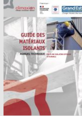
Guide des matériaux isolants