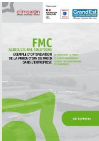
Exemple d'optimisation de la production de froid dans l'entreprise