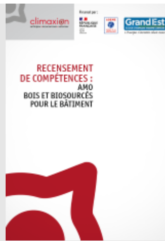
Recensement de compétences : AMO Bois et Biosourcés pour le bâtiment