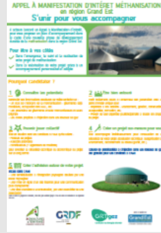
Appel à Manifestation d'Intérêt biométhane