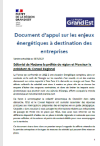
Appui sur les enjeux énergétiques à destination des entreprises