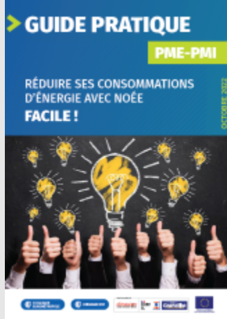
PME-PMI : Réduire ses consommations d'énergie