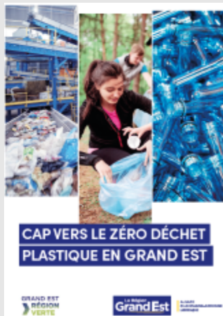
[Synthèse] Stratégie zéro déchet plastique en Grand Est