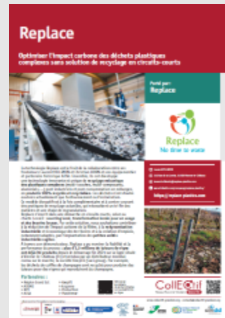
[Retour d'expérience] Optimiser l'impact carbone des déchets plastiques complexes