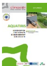
Fiche exemple Economie Circulaire : Entreprise Aquatiris