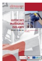
Guide des matériaux isolants