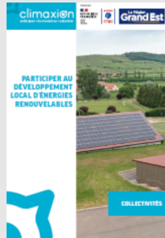
Collectivités - Participer au développement local des énergies renouvelables