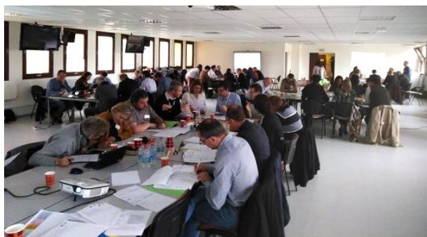
1 er atelier inter-entreprises en Avril 2019 réunissant 50 entreprises

Sur le volet des déchets, une collecte mutualisée de papiers cartons est en cours. D'autres collectes sont en évaluation sur les déchets du BTP et les déchets plastiques.