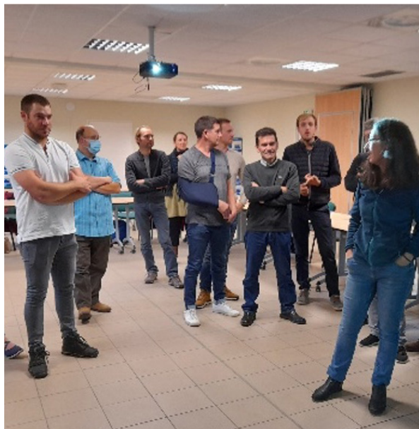
Débat mouvant avec les agriculteurs du territoire au cours d'une session de formation dans le cadre de l'obtention des aides agricoles