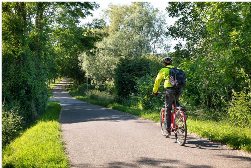
Cycliste sur le territoire du Bassin de Pompey.