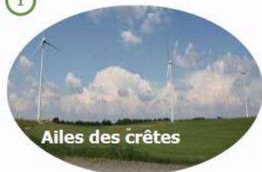
Ailes des crêtes

Dans la Communauté de Communes très active des Crêtes Préardennaises, le parc éolien citoyen des « Ailes des Crêtes » a été mis en service en 2016. Composé de 3 éoliennes, ce parc produit l'équivalent de la consommation électrique de 1600 foyers.