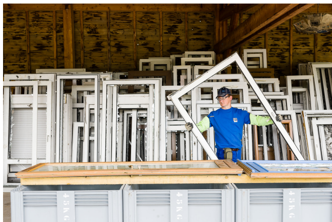
Recyclage des fenêtres PVC en fin de vie