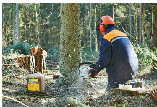
Biolubrifiants pour le marché de la foresterie