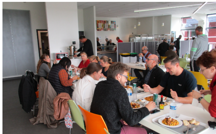
Restauration collective partagée