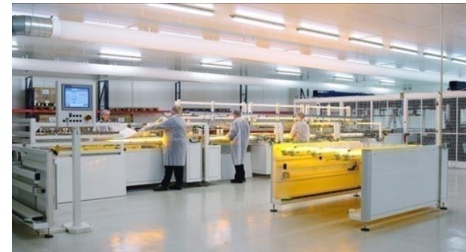
Usine Voltec Solar