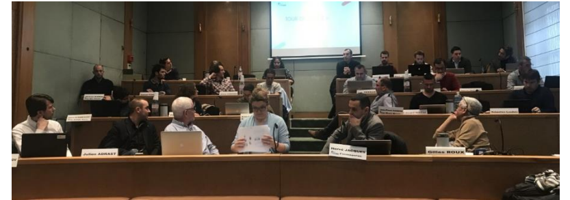
Commission Technique du GMPV 6 décembre 2018