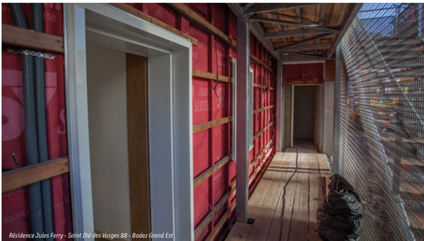
Résidence Jules Ferry - Saint Dié des Vosges 88 - Bodez Grand Est